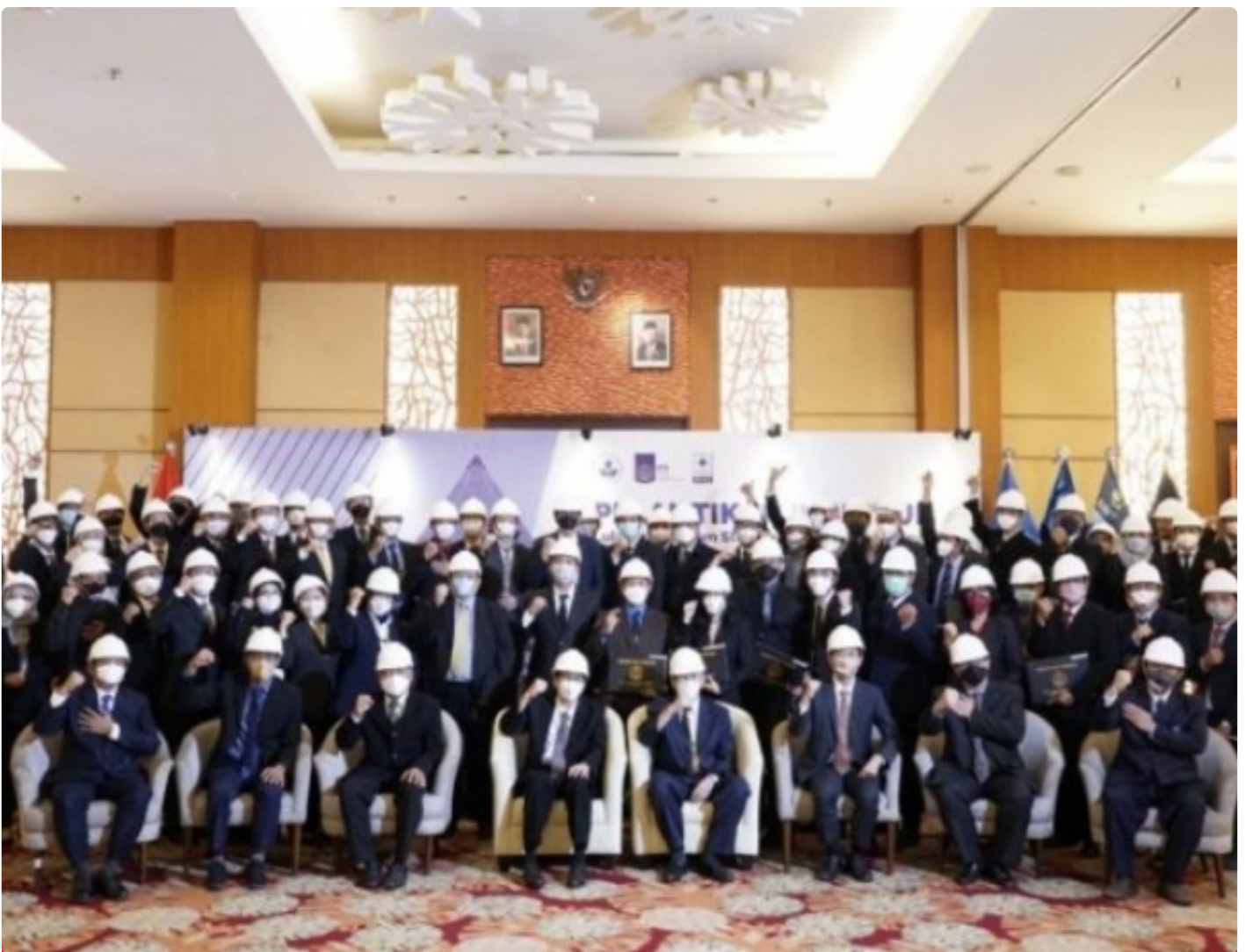
Ke-93 insinyur baru dari ITS bersama jajaran pimpinan ITS dan Persatuan Insinyur Indonesia Wilayah Jawa Timur

SURABAYA – Hingga saat ini, insinyur yang diakui secara formal di Indonesia baru mencapai sekitar 10.900 orang, padahal jumlah lulusan sarjana teknik dan serumpunnya melebihi 1 juta orang. Berkontribusi untuk mengatasi profesi