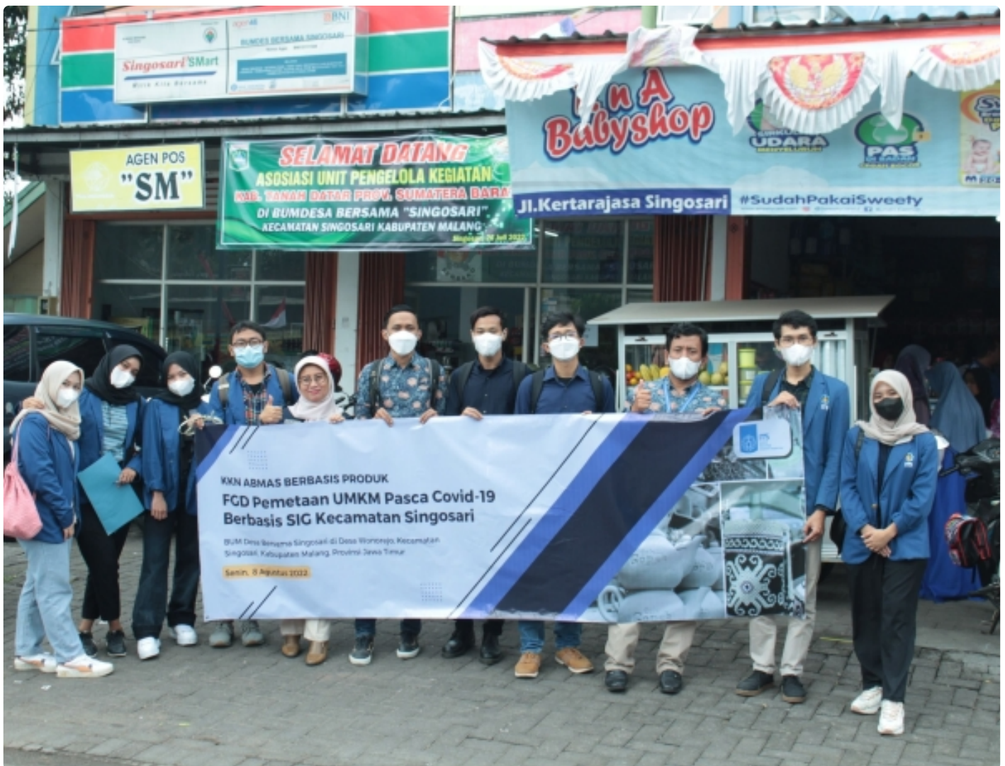
Tim KKN Abmas Berbasis Produk untuk FGD PEMetaan UMKM Berbasis SIG Kecamatan Singosari Malang

MALANG – Peran aktif Pusat Kajian Kebijakan Publik Bisnis dan Industri (PKKPBI) ITS dalam mendorong digitalisasi Badan Usaha Milik Desa (BUMDes) terus berlanjut. Hal ini sejalan dengan komitmen institut dalam mewujudkan Sustainable Development Goals (SDGs), termasuk poin sembilan tentang infrastruktur, industri, dan inovasi.